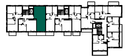
RZUT KONDYGNACJI I PIĘTRO