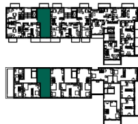
RZUT KONDYGNACJI IV PIĘTRO + ANTRESOLA

ul. Lotnicza 113, Banino 801 007 008 info@siodme-niebo.pl