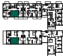
RZUT KONDYGNACJI IV PIĘTRO + ANTRESOLA

ul. Lotnicza 113, Banino 801 007 008 info@siodme-niebo.pl